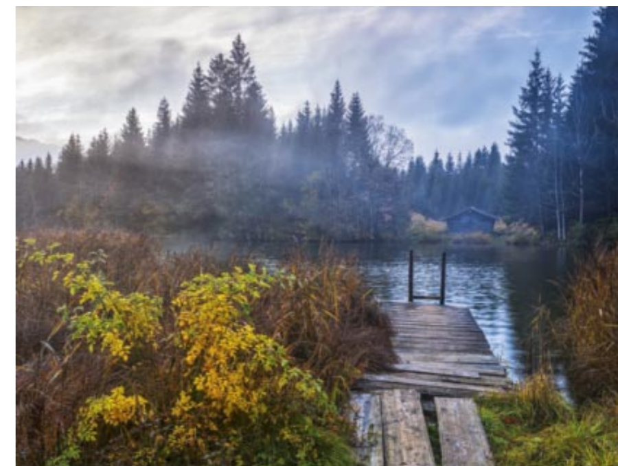
Oben: Nahe dem Nationalpark-Zentrum Königsstuhl auf Rügen – ein Blick, der zum Verweilen einlädt. So beeindruckend die Kreidefelsen auch sind – es gibt dort viele weitere Motive, die mich in ihren Bann ziehen.

Mittelformat-Sensor | 35 mm | 1/10 sec | f/10 | ISO 100 | Weißabgleich 5.200 K | Polfilter | Stativ