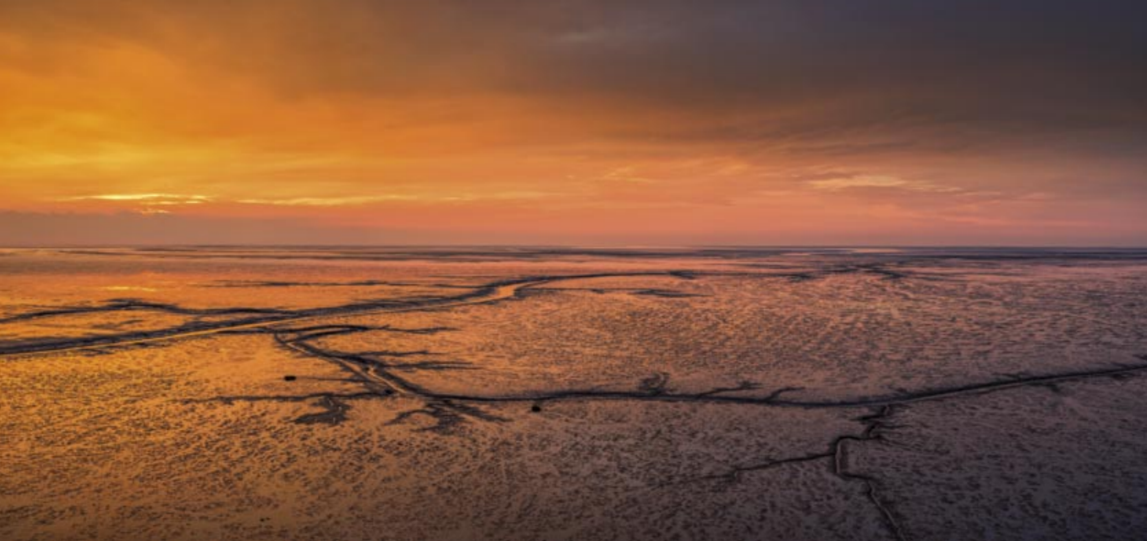
Weit hinaus reicht mein Blick vom Leuchtturm Obereversand über das Wattenmeer im Wurster Land. Begleiteten mich vom Parkplatz zum Leuchtturm noch die letzten Regentropfen, verfärbt sich der Himmel zusehends in der aufkommenden Abenddämmerung.

Kleinbild-Sensor | 45 mm | 1/5 sec | f/11 | ISO 125 | Weißabgleich 5.900 K | Graufilter ND 0,9 + Grauverlaufsfilter ND 0,6 hard | Stativ | Panorama aus 6 Einzelbildern