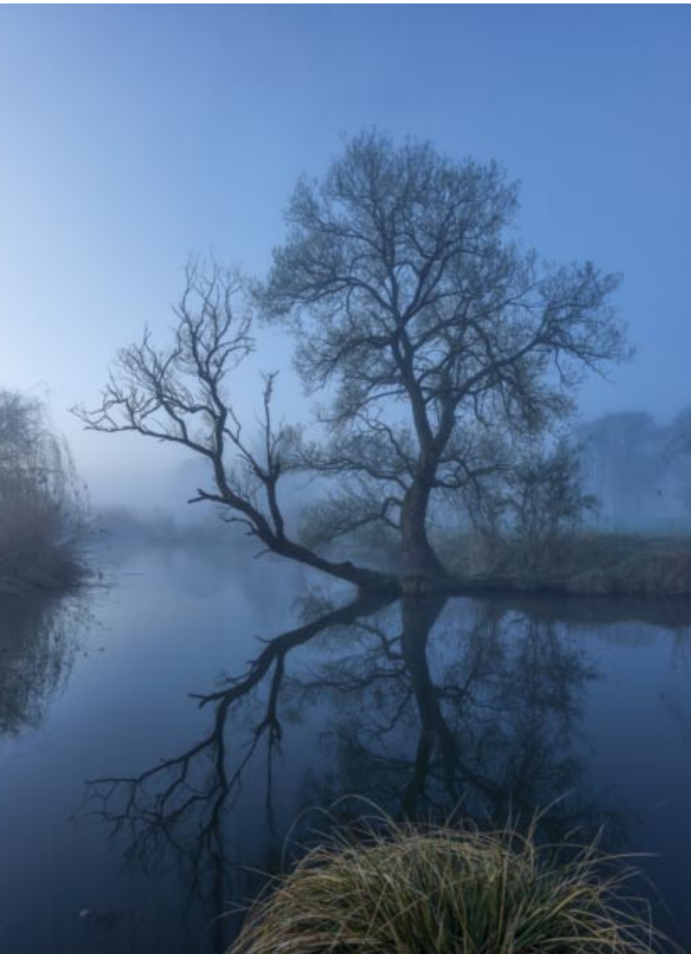
Oben: Ein stiller Frühlingmorgen im Schmuttertal, das zuletzt nach einem Dammbrech durch Hochwasser im Juni 2024 medial in aller Munde war. Mittelformat-Sensor | 32 mm | 30 sec | f/11 | ISO 50 | Weißabgleich 6.000 K | Polfilter | Stativ